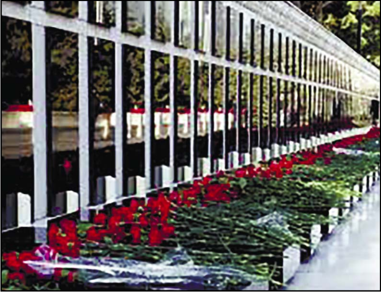
Azərbaycan Xarici İşlər Nazirliyi 20 Yanvar faciəsinin ildönümünü ilə bağlı bəyanat yayıb.

"Unikal" xəbər verir ki, bəyanatda bildirilib: "1990-cı il yanvarın 19-dan 20-nə keçən gecə SSRİ rəhbərliyinin əmri ilə Sovet Ordusu bölmələri və xüsusi təyinatlılar, habelə daxili qoşunların kontingenti tərəfindən Azərbaycana qarşı hərbi təcavüz nəticəsində Bakı və Sumqayıt şəhərlərində, Lənkəran və Neftçalada dinc əhaliyə, o cümlədən uşaqlara, qadınlara və qocalara qarşı qətlə təminat törədildi. İşğalçı qüvvələrin hərbi təcavüzü nəticəsində 149 mülki şəxs qətlə yetirildi, 744 nəfər ağır yaralandı, 4 nəfər itkin düşdü. SSRİ rəhbərliyinin Azərbaycan xalqına qarşı ayrı-seçkilik siyasətinə, yüz minlərlə azərbaycanlıların indiki Ermənistan ərazisindəki tarixi torpaqlarından deportasiya edilməsinə və Ermənistanın Qarabağa qarşı əsassız ərazi iddialarına cavab olaraq Azərbaycan xalqının keçirdiyi kütləvi etirazları və başlatdığı milli azadlıq hərəkatını güc yolu ilə yatırmaq məqsədilə öl-